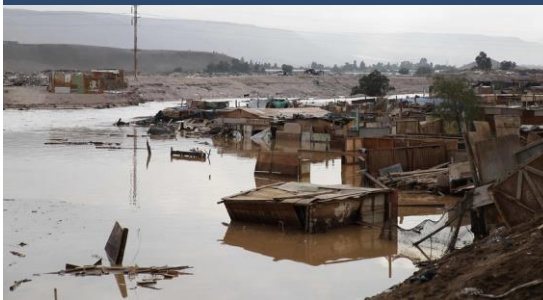
Lluvias estivales y desbordes de ríos