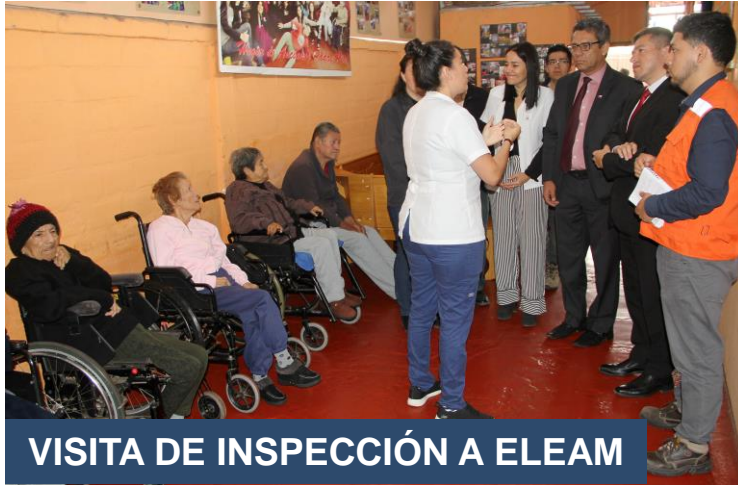
VISITA DE INSPECCIÓN A ELEM