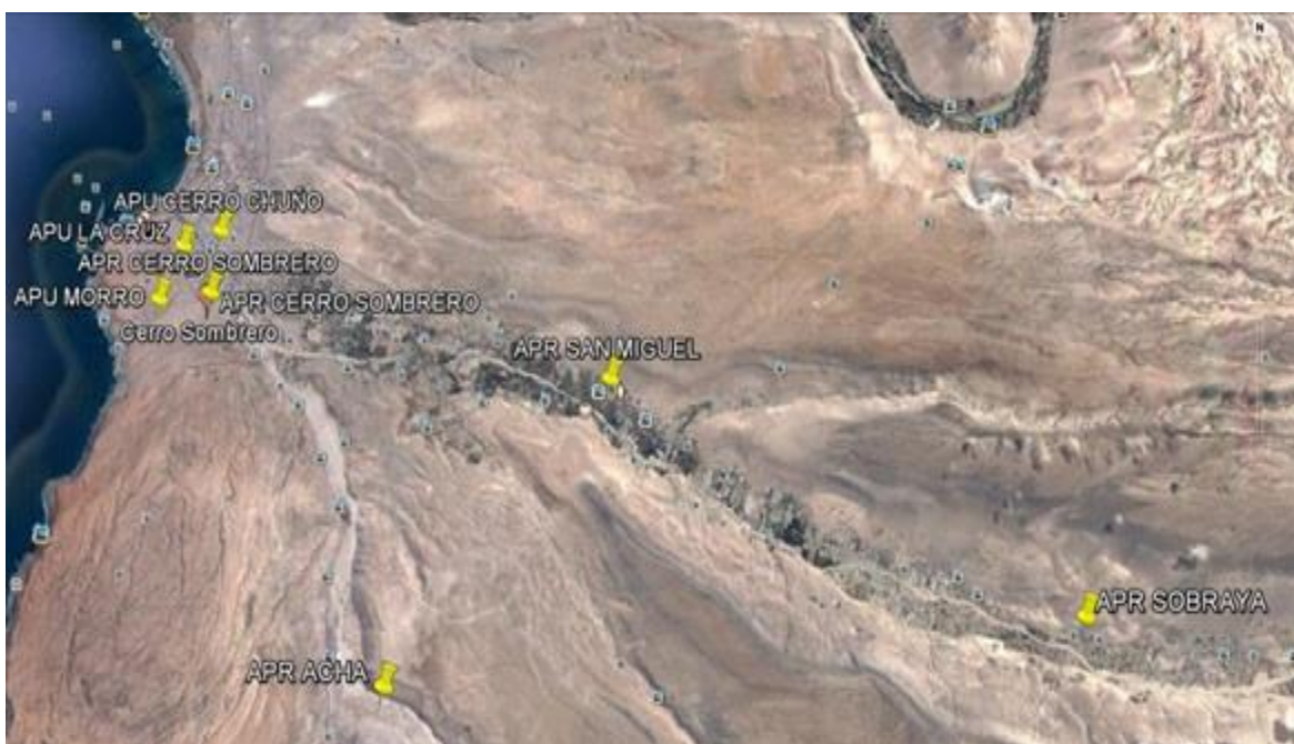
Figura N°1. Graficación Territorial Muestreo Agua Consumo Humano año 2017